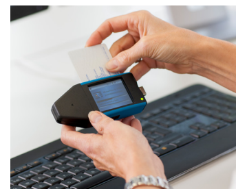
Direkter Datendownload ab Fahrerkarte