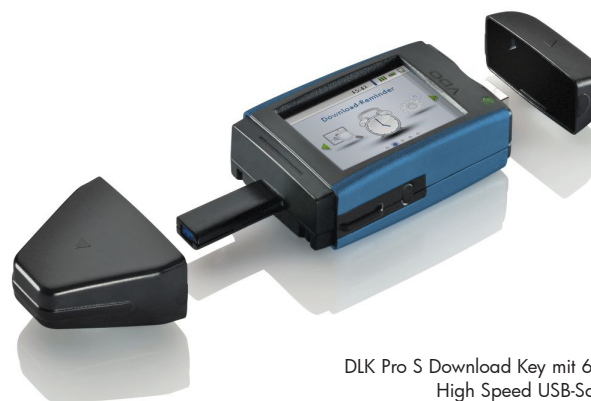
DLK Pro S Download Key mit 6-PIN- und High Speed USB-Schnittstelle